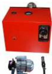
Citerm Junior 35-65 kW moniöljypoltin 1 773,20 eur (sis. 24 % ALV)