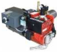
GIER SCH MONIÖLJYPOLTTIMET