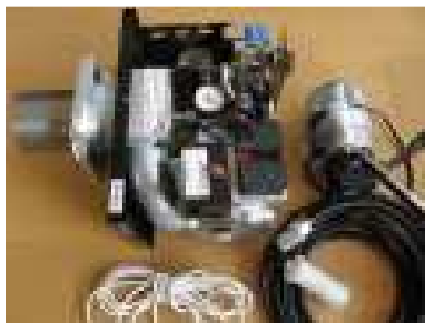
Citerm Junior 25-35 kW moniöljypoltin 1 773,20 eur (sis. 24 % ALV)