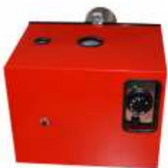
CITERM GP JUNIOR